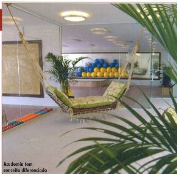
Academia tem conceito diferenciado

sa parte. Tem gente que pede mudas de plantas para mim e até se coloca à disposição para ajudar nas nossas iniciativas", diz.