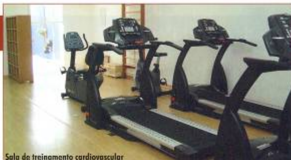
Sala de treinamento cardiovascular