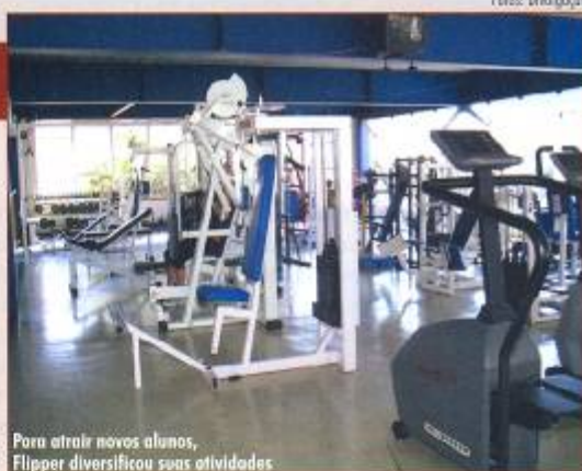
Para atrair novos alunos, Flipper diversificou suas atividades

Outro ponto a ser destacado é que a tradicional escola passou a agregar diferentes modalidades esportivas, vindo a trabalhar a qualidade de vida e o bem-estar das pessoas. A Flipper também oferece ginástica, musculação, hidro, Body Systems, lutas marciais, boxe, capoeira e, mais recentemente, ioga.