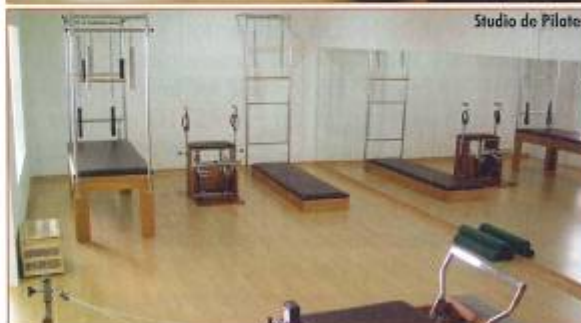
Studio de Pilates

O diretor diz que "a forma de alcançar esse objetivo é através de uma experiência de bem-estar aliada a atividades como pilates, ioga, condicionamento cardiovascular, ginástica natural, treinamento funcional, alongamento consciente, treinamento para corrida e caminhada, RPG, meditação, alimentação balanceada, massagens terapêuticas e palestras".