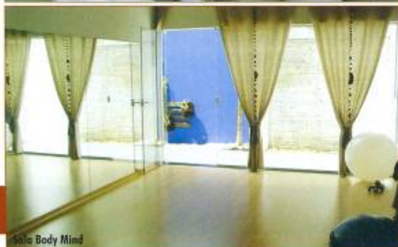
Sala Body Mind